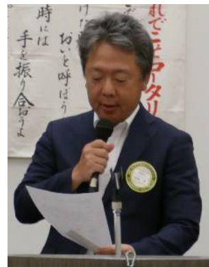
水城親睦活動委員長