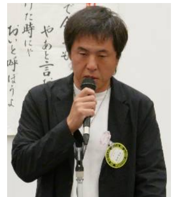
西村出席副委員長