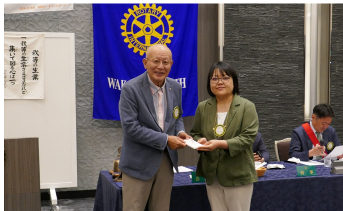
越部早絵会員 連続出席6年