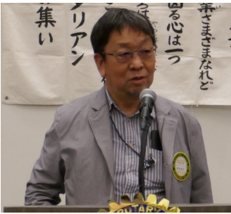
野島親睦活動委員