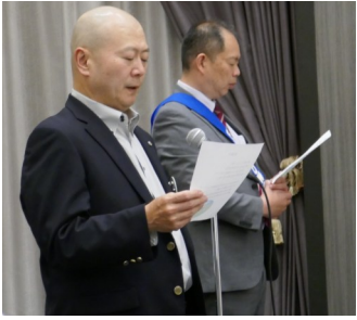
戸井ソングリーダー 「茶摘み」