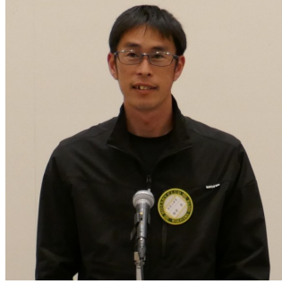
堀井出席副委員長