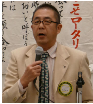
ロータリーの友1月号を紹介させて頂きました。