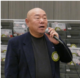
毘舍利ソングリーダー 「それでこそロータリー」