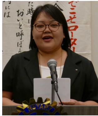
越部親睦活動委員長 本日 ゲストのご紹介