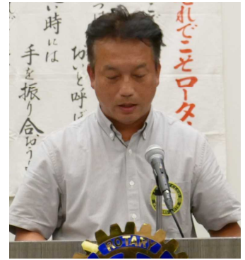
雑賀出席委員長 本日の出席報告