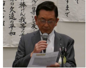
嶋谷出席委員長 本日の出席報告