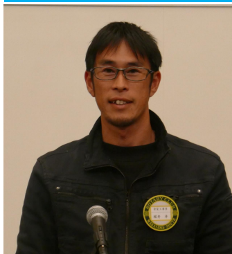
堀井親睦活動委員 本日 ゲストのご紹介