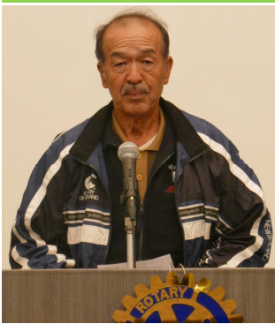
山本出席委員 本日の出席報告