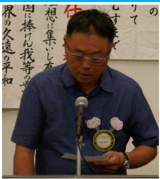
坂東出席委員長 本日の出席報告