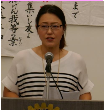
川島親睦活動委員 本日 ゲストのご紹介