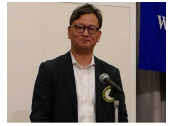
志賀親睦活動委員 本日 ゲストのご紹介

前週の報告 2023年8月25日(金) 出席報告 会員72名(出席規定適用免除会員6名) 出席48名 ホームクラブ出席者66. 67%