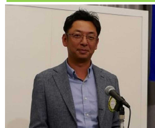
宮本出席副委員長 本日の出席報告