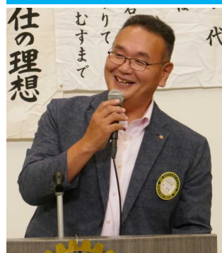
林親睦活動委員長 本日 ビジターのご紹介