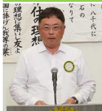
坂東出席委員長 本日の出席報告

前週の報告 2023年7月 7日(金) 出席報告 会員71名(出席規定適用免除会員6名) 出席49名 ホームクラブ出席者69.01%