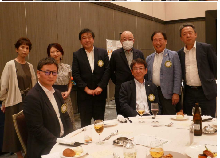
2023-2024年度テーマ:「 enjoy ROTARY and plus 1 」