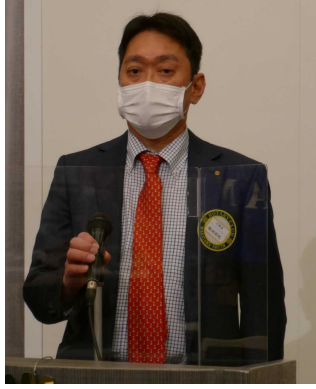
植田親睦活動委員長 本日のゲスト・ビジターのご紹介