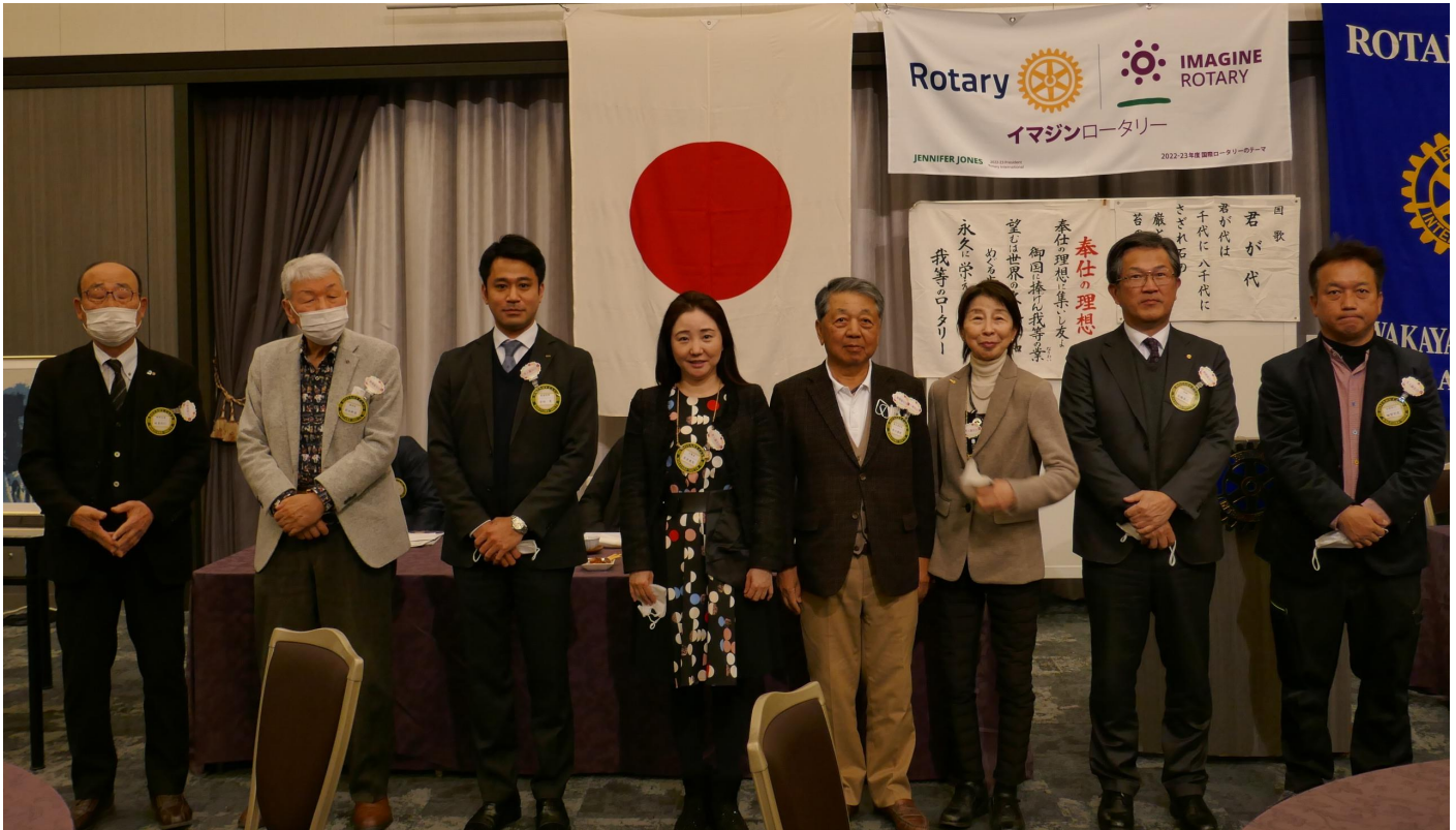
親睦活動委員会メンバー