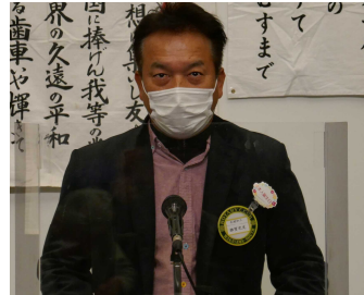
雑賀出席委員長 本日の出席報告

前週の報告 2023年3月3日(金) 出席報告 会員71名(出席規定適用免除会員6名) 出席46名 ホームクラブ出席者64. 79%