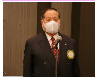
大林SAAソング副委員長 本日のソング 「君が代」・「奉仕の理想」