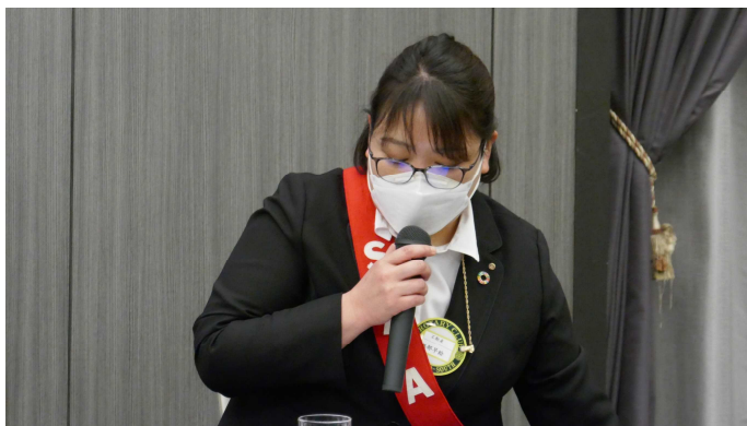
本日のSAA担当は越部SAA・ソング委員長