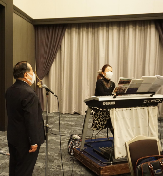
大林SAAソング副委員長 本日のソング 「それでこそロータリー」