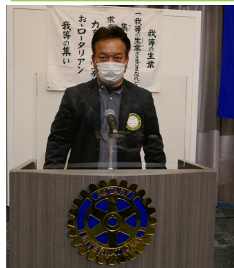
雑賀出席委員長 本日の出席報告