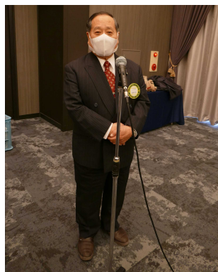
大林SAAソング副委員長 本日のソング 「我等の生業」