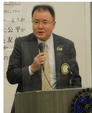
親睦活動委員会よりゲスト紹介