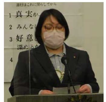
出席委員会より 本日の出席報告