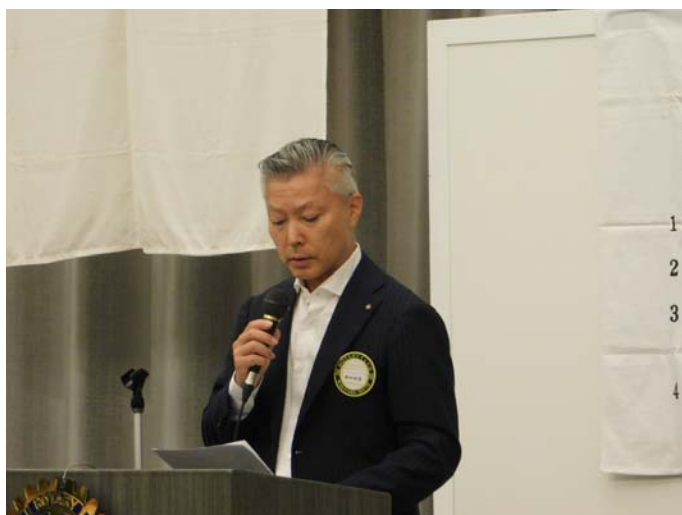
任意例会の議長を務める樫畑会長

(b)年次総会においては、次年度の理事の選挙を行い、あわせて現年度の収入と支出を含む中間報告および前年度の財務報告を発表する。