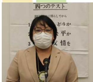
出席委員会より 本日の出席報告