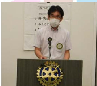
親睦活動委員会よりゲスト紹介