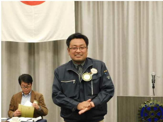
1月奥様お誕生祝の金谷会員です。