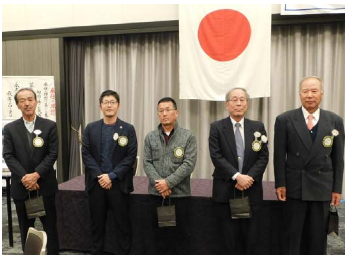
12月誕生祝の皆様です。